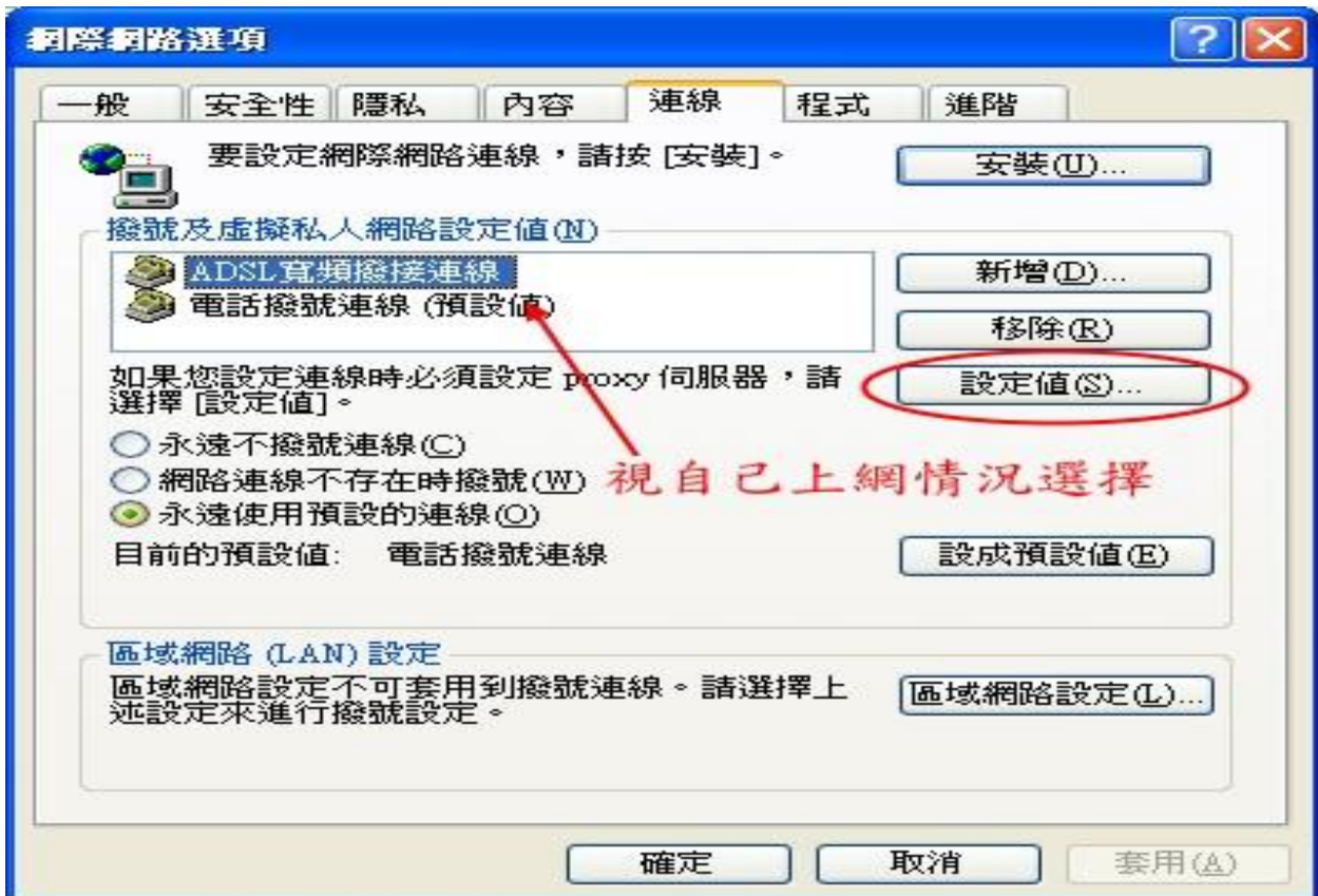
(圖三) 如果您是以撥號方式上網 -- 之二